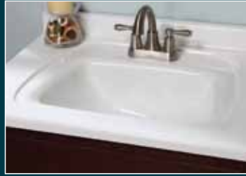
Integral Recessed Rectangular Rectangular integrado