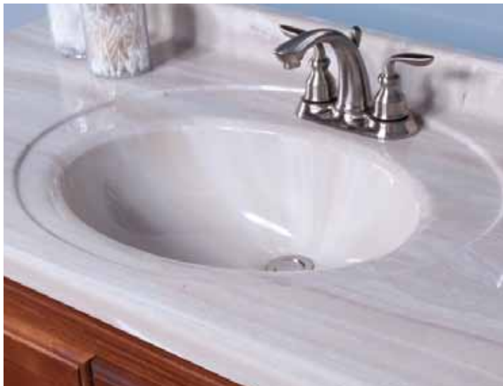
Integral recessed oval bowl style Estilo ovalado integrado