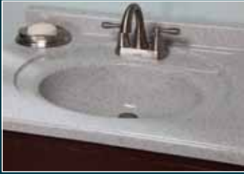
Integral Recessed Oval Ovalado integrado