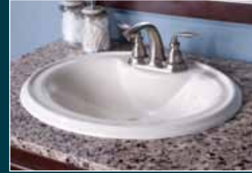
Oval Drop-in Drop-in Ovalado