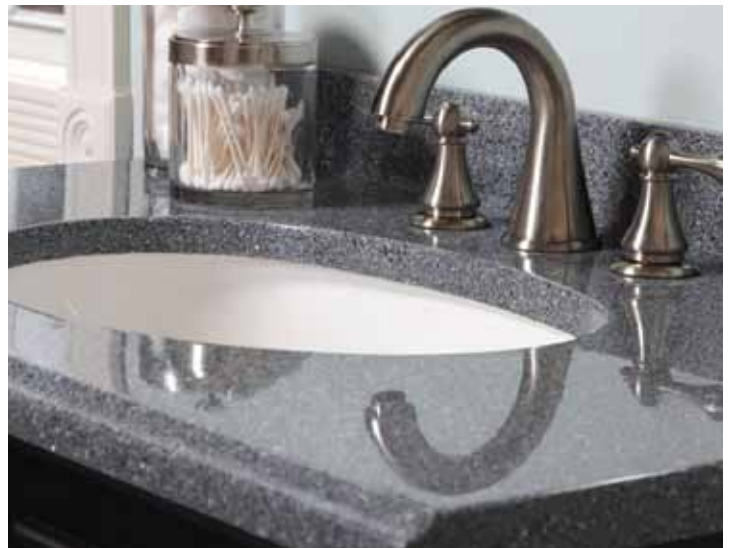
Oval undermount bowl style Estilo ovalado montado