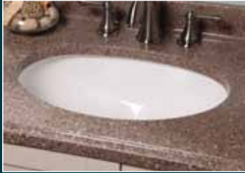
Oval Undermount Ovalado montado