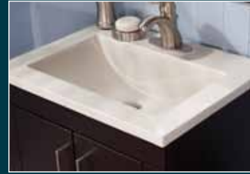
Integral Rectangular Rectangular integrado